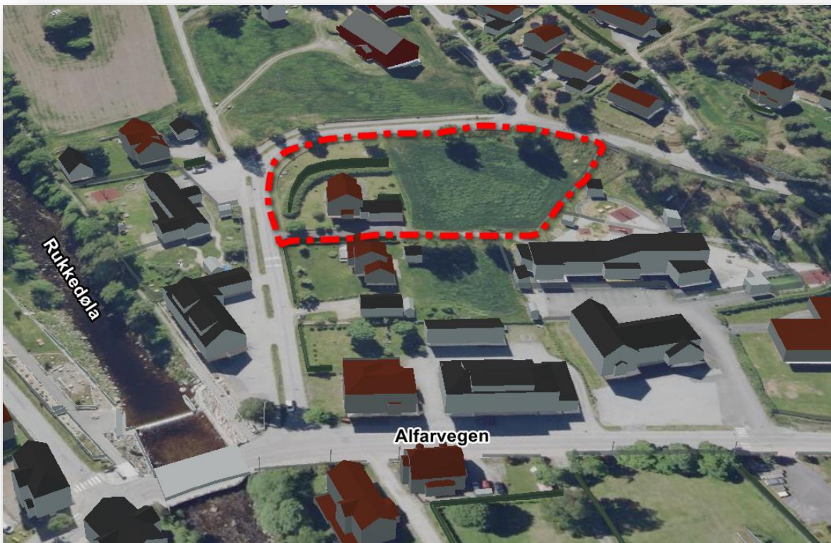
Ortofoto og omtrentlig plangrense med rød linje.