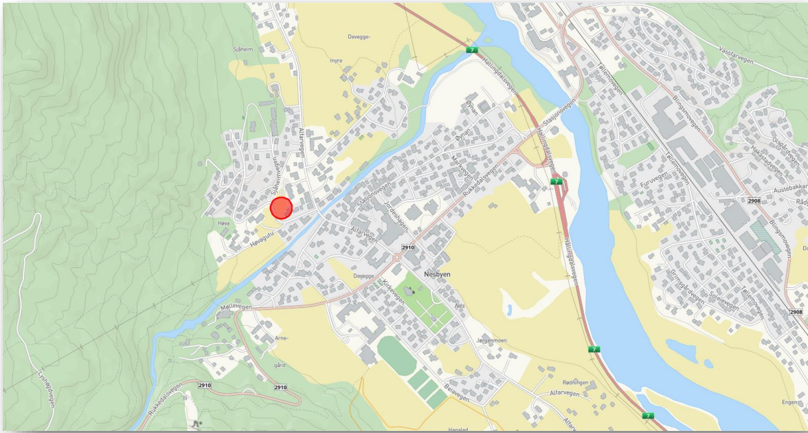
Planområdets plassering i forhold til Nesbyen sentrum