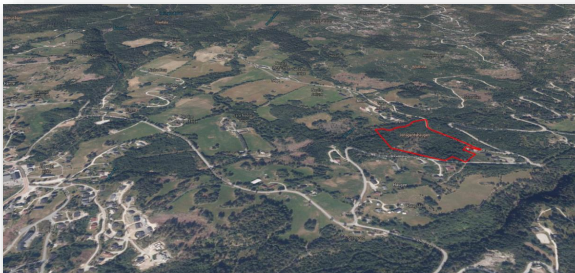
Ortofoto og omtrentlig plangrense med rød linje.